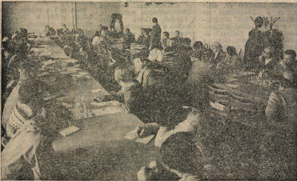
A tanácskozás délelőttjén tele volt a tanácsterem

Egész napos tudományos konferencia a képzés reformjáról