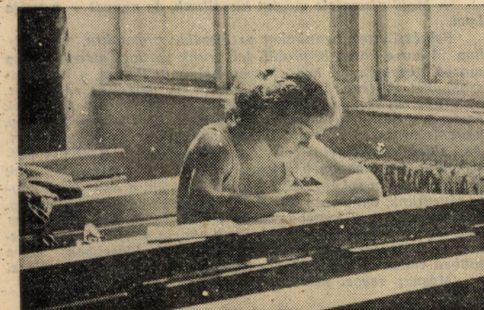
Egyedül a gondban

a Magyar Közgazdasági Társaság hallgatói szakcsoportja