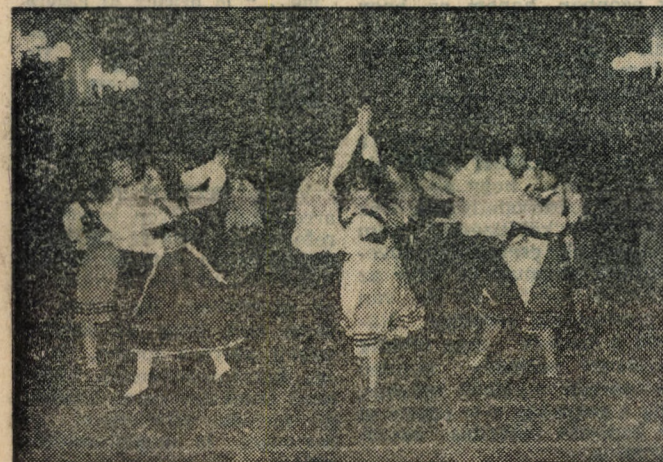
Sörbál vagy gólyabál címmel cikk a 8. oldalon az idei gólyabálról