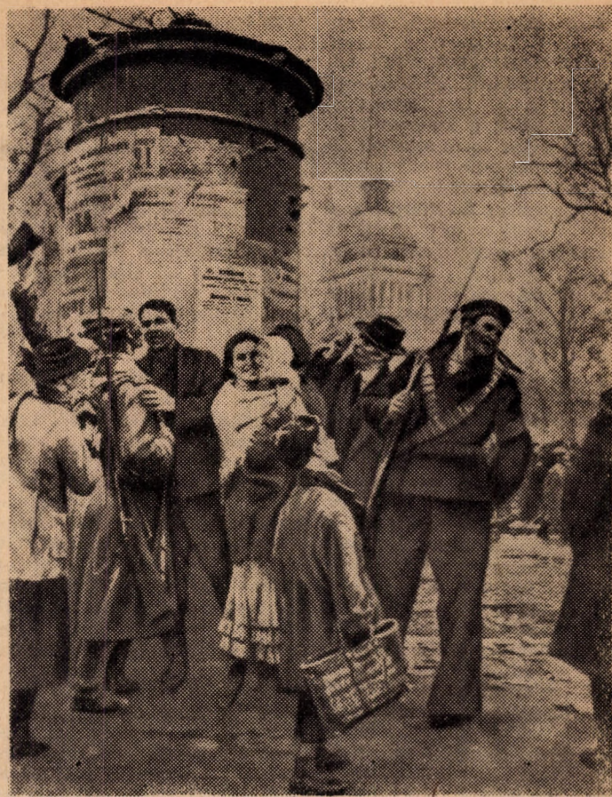
A szovjethatalom első szava: béke