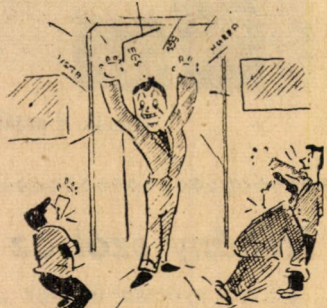
Fiú vagy lány?