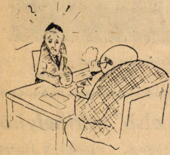
Mi ketten egyedül.