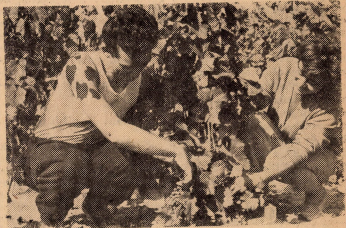
Munka közben a „töke” két oldalán.

III. évfolyam belker, szakosok október elején a Buda-keszi Állami Gazdaságban szüreteltek. Az alábbi képekben számolunk be röviden hallgatóink munkájáról.