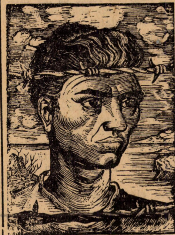
A görög szabadságharcosok még ma is börtönben szenvednek, mert felemelték szavukat az igazság mellett