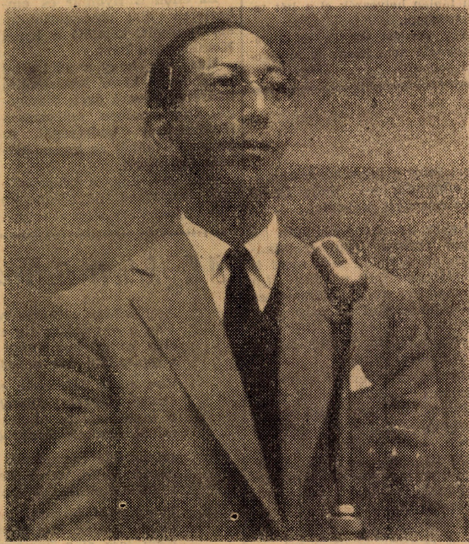
Kinkazu Szajonzsi japán békeharcos, a Béke-Világtanács titkára

Természetesen, a háború visszahatása meglátszik, sajnos, még ma is — fejtette ki a gondolatot a világhírű japán békeharcos —, az ifjúság erkölcsi moráljában. A háború befejeztével két vonalon jelentkezett veszély: az egyik a nihilizmus. Ennek demoralizálta a fiatalokat, egész kis gyerekek rászoktak a cigarettázásra, nagy mennyiségű szesz-