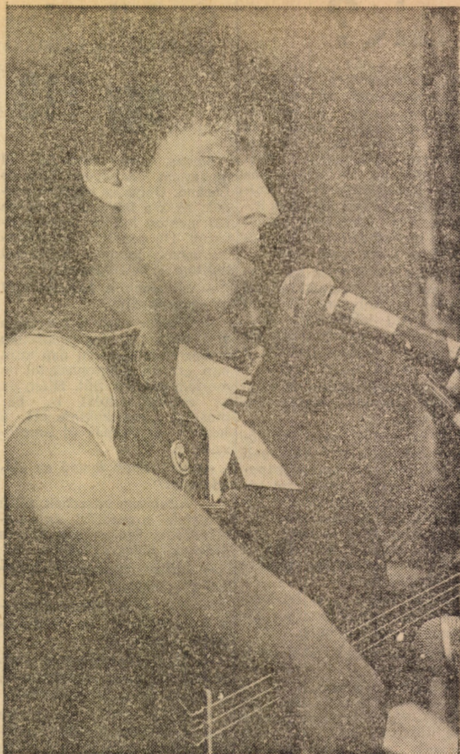
Ez is Amerika...