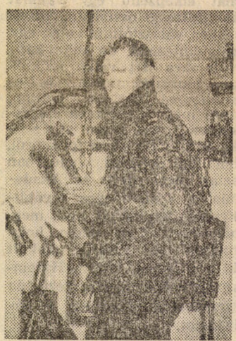
A Savinfúzió műsorából