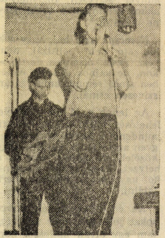
A Zahgurim Angliából