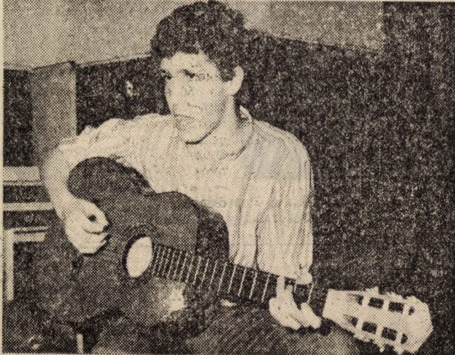
Azért megszólalt a gitár is...