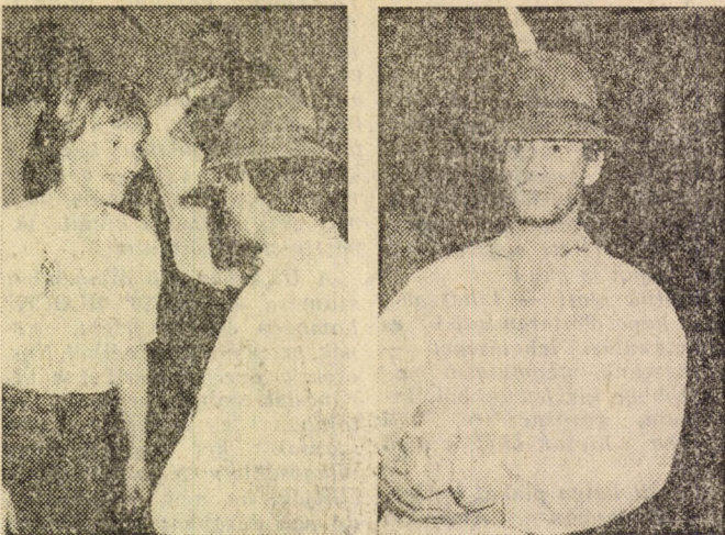
(Bontott) Lúdas Matyi az egyetlen jelmezes vendég, február 13-án a Kinizsi farsangi bálján