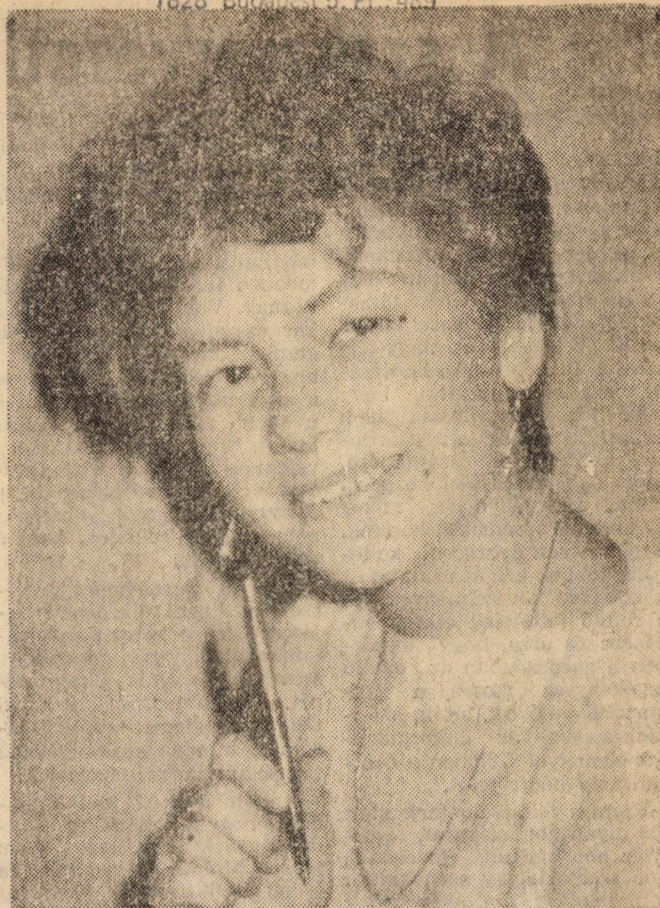
A nemzetközi nőnap alkalmából köszöntjük a lányokat és az asszonyokat

A díjak első kiosztására az 1986. szeptemberi tanévnyitón az 1983/86-os tanév értékelése alapján kerül sor.