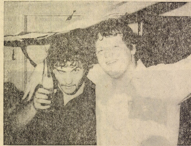
Ez a Pepsi-örzés