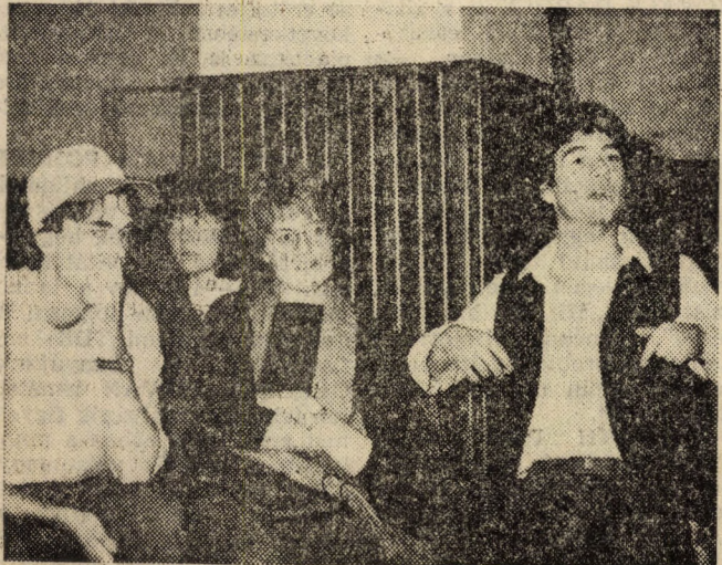
Amerikai diákok — vita közben