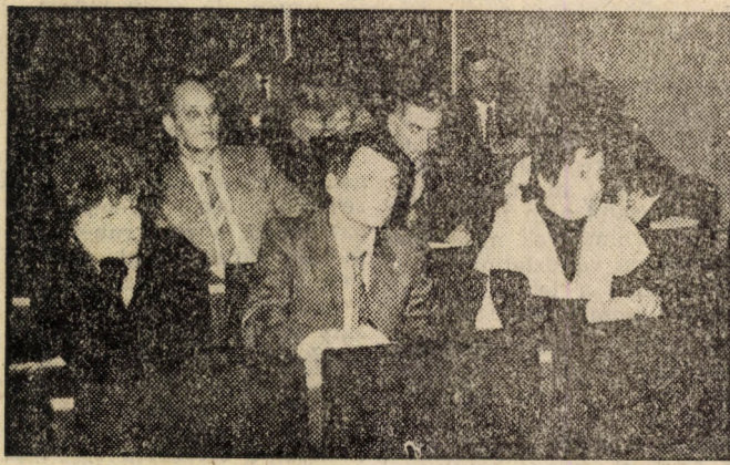
A konferencia résztvevői