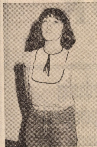
Kicsi vagyok, székre állok...