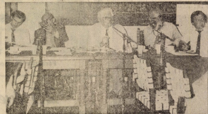
A kerekasztal-beszélgetés résztvevői

CSIPKÓ SÁNDOR: Tapasztalunk szerint minél erő-