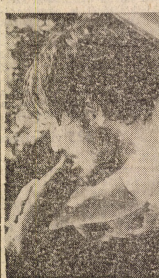
„Húzd, ki tudja meddig...”