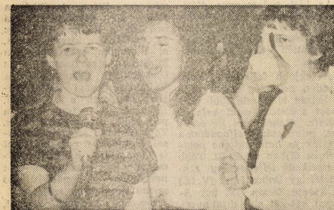
Három törökballati vidám leány