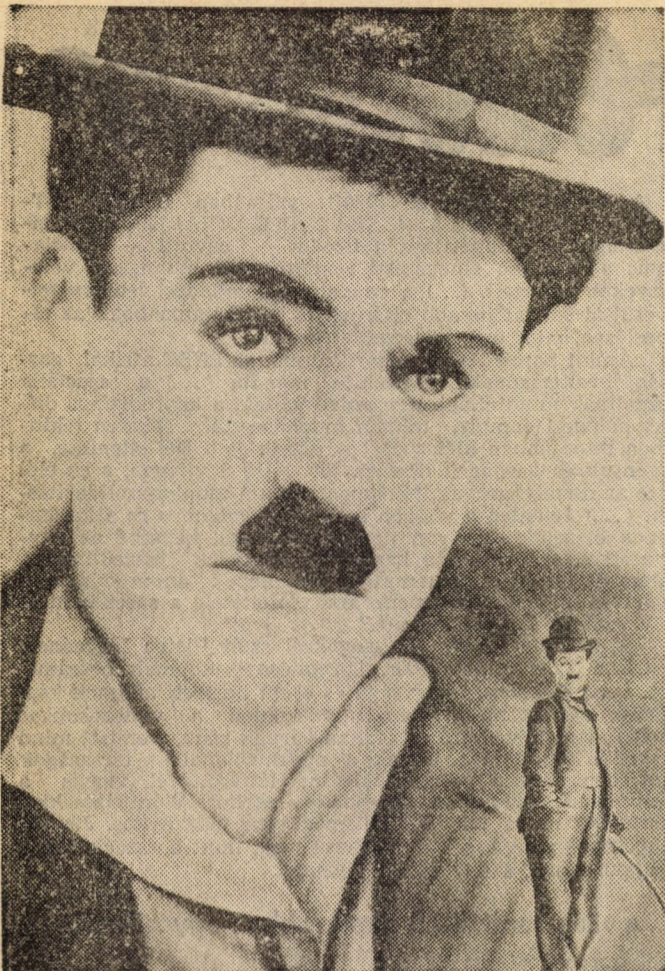
Chaplin.