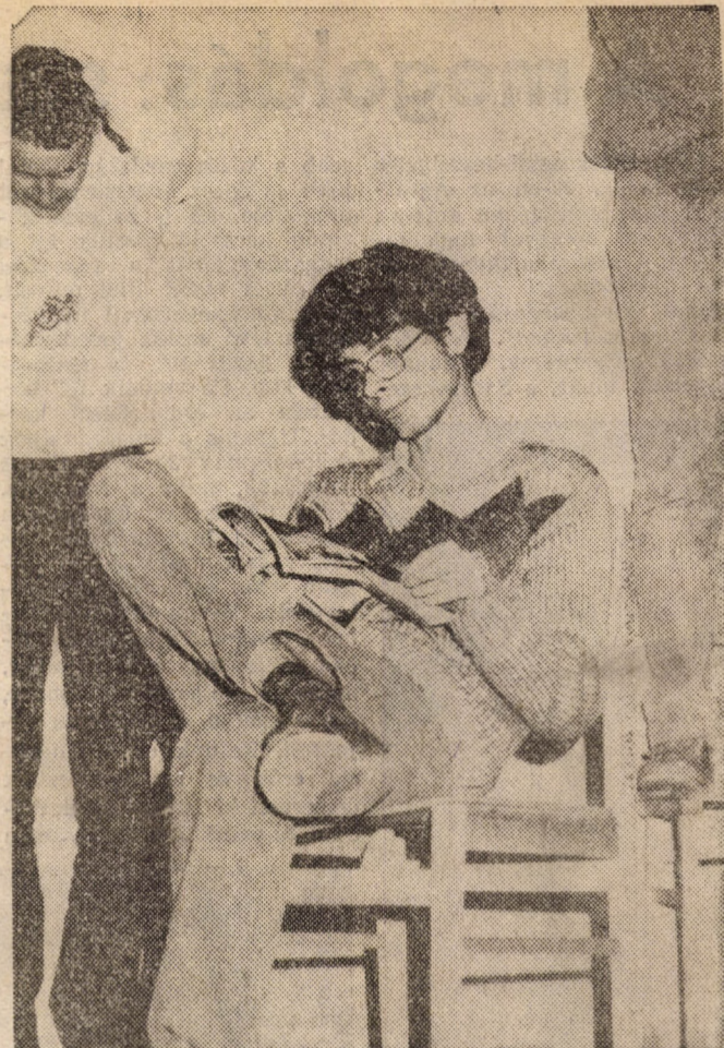
Fárasztó Theáter: Godot-ra várva

A Marx Károly Közgazdaságtudományi Egyetem lapja Felelős szerkesztő: FARKASINSZKYNE HALAY EDI Szerkesztőség: 1093 Budapest IX., Dimitrov tér 8 Telefon: 174 548 Kiadó: Hírlapkiadó Vállalat Budapest, VIII., Blaha t. uza tér 3 Felelős kiadó: TILL IMRE vezérigazgató 86-1344 Szikra Lapnyomda, Budapest Felelős vezető: CSÖNDES ZOLTÁN vezérigazgató