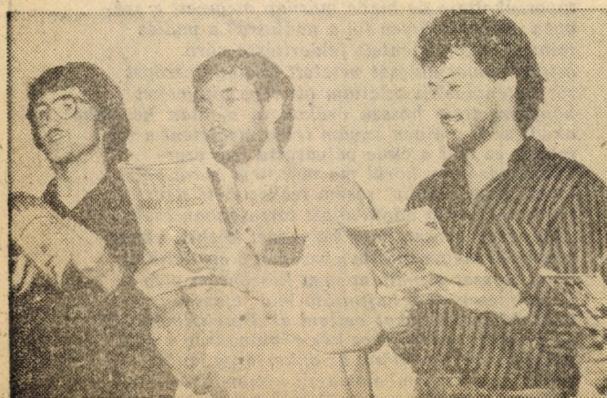
Három Törökballati Vidám Fiú