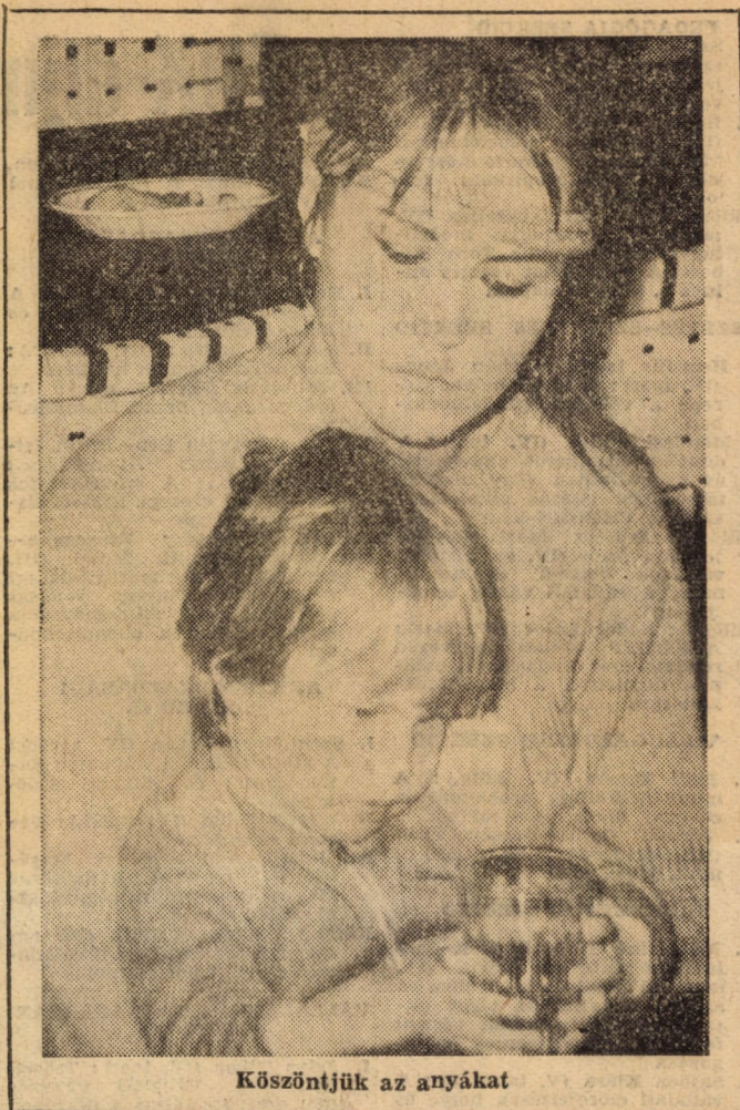
Köszöntjük az anyákat