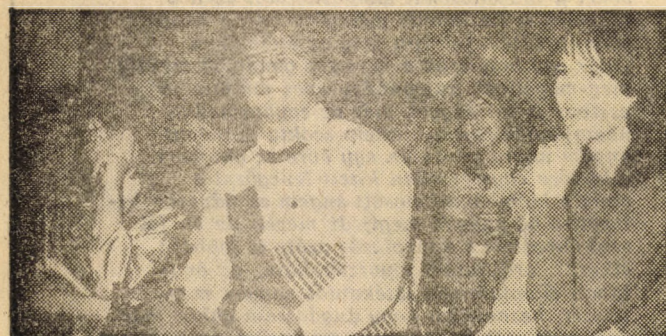
A KEN(D) MIT TUD zsűrije