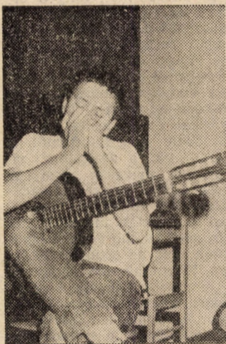
En csak fújom a dalt