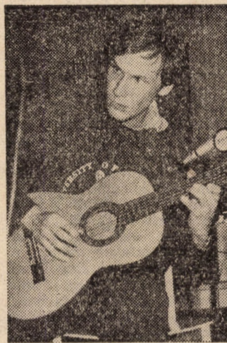
Egy penge pengető