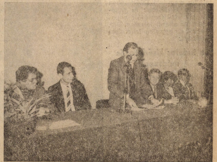
A november 7-i ünnepség elnöksége