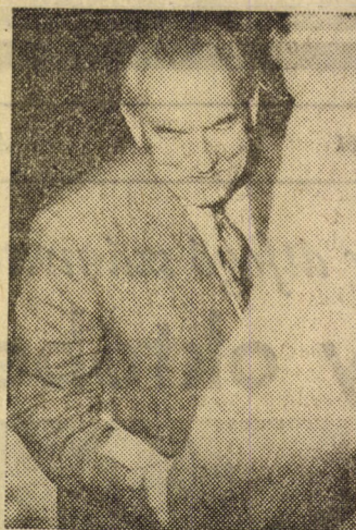
Gyurkó tanár úr átveszi a kitüntetést