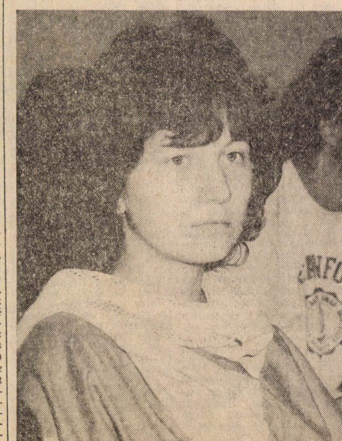
Még nem tudom mit gondoljak...

tív tárgyakat, vagy csak a teljes szabad választást? Mindenesetre a kritériumrendszer és az alternatívák nyilván összefüggenek majd egymással. A téma része a szakirányok lassan tisztuló meghatározása, a szakszemináriumok, szakmai gyakorlat, államlvizsga, és diploma megjelölésének rendezése. Külön kérdés az oktatási formák, a számonkérés fejlesztése, a trimeszteres rendszer, a folyamatos értékelés kialakítása. Csak a még függőben levő legfontosabb feladatokat felsorolva is jól látszik, hogy a képzéskorszerűsítés szervezeteire, a bennük dolgozó oktatókra nemcsak eddig vezetett munkájuk korrigáló felülvizsgálata hárul, hanem jelentős további munka elvégzése is. Eppen ezért a korszerűsítés intézményeinek meg erősítése a korszerűsítés előrehaladásának záloga.