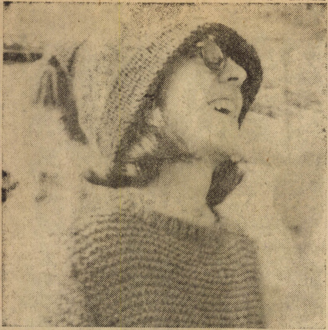
Szerencséd, hogy öreganyádnak szólítottál