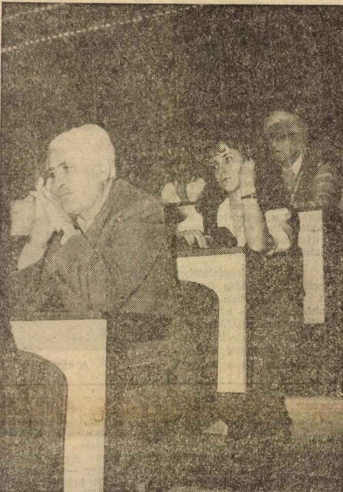
Az ünnepség résztvevői

ra az államiság túlsúlyossá, a politikum öntüreltékelővé vált, s ezen változtatnunk kell.