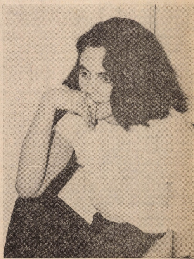
„Biztosítok, tehát vagyok?”