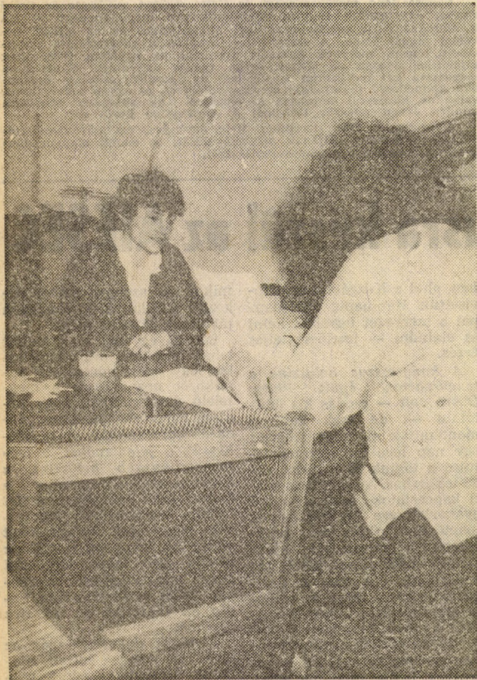
Kellemes (?) percek.

— Kishitű vagy, hisz általában jól vizsgázol.