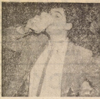
Téma: a liquiditás

— Sok sikert! Ezután egy lányt pillantok meg, aki éppen a puskáit rendezgeti.