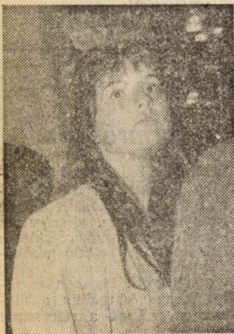
Vizsga — naiva

són, ki-ki más-más idegállapotban, más célokkal. Beszélgetőpartnereim már több vizsgát megért „tapasztalt rókák”, mégis mind mások. Egy-egy típust képviselnek, olyan típust, amelyből több száz szaladgál köztünk. E cikkben nem ítélek el senkit, a jó diákot sem fogom bemutálni — ezt az olvasóra bízom, bár kétségkívül nekem is van „kedven-cem”.