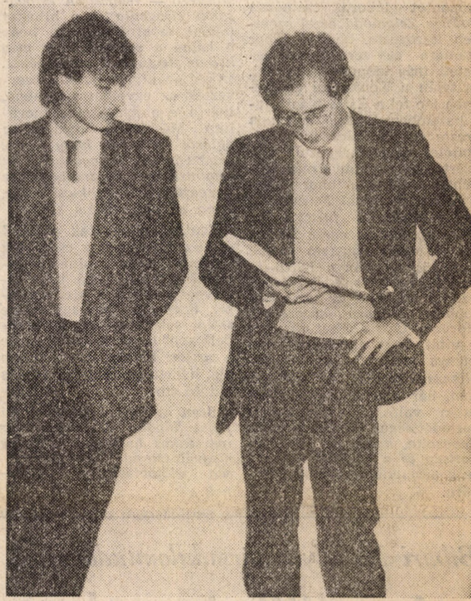
Ki, kinek a patrónusa?