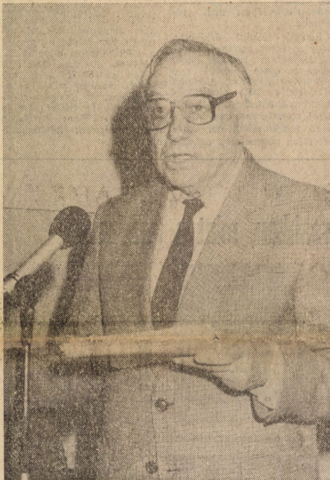
Faluvégi Lajos: túlértékeltek a stabilitást