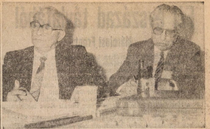
Munkában a zsűri