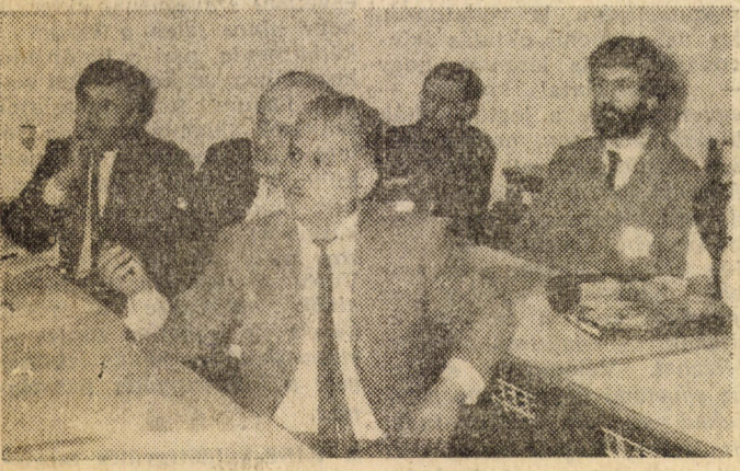
Tanárok és diákok a közönség soraiban