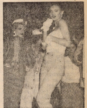
Csak a ruhák eladók!