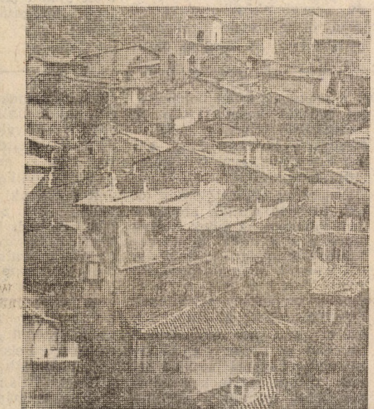
SCANNO, a nemzeti park legmagasabbra felkapaszkodó települése

Kegyeltes Szent Máriának Kongregációja. Az ajtón rozsdás lakat. Saarral, az izraeli fiúval rugdossuk a vakolatot és tört agnalsággal próbálunk beszélgetni. Közben időnként az az érzés vesz erőt rajtam, hogy a következő ház mögül maga Sparafucile személyesen lép elő. „Mit csinálsz majd, ha végzel?” — kérdelem, nem biztos hogy oxfordi angolsággal. „Meygek katonának egy évre.” „Nem félsz a katonaságtól?” Arrafelé, felétek manapság ez elég veszélyes dolog.” „En szeretem a hazámat, a hazának szüksége van katoná-