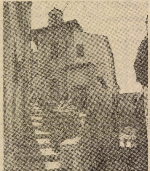
Az 5 kis falujuk

Romano olaszul rómaiak jelent, de aki ezt a nevet nyerte a keresztvíz alatt, nem annyira a főváros lakosaival, mint inkább a régi rómaiakkal tart transzcendens kapcsolatot. Romano egyáltalán nem úgy néz ki, mint egy tipikus olasz. Világosbarna a haja, a kellemes puhányságnak semmi