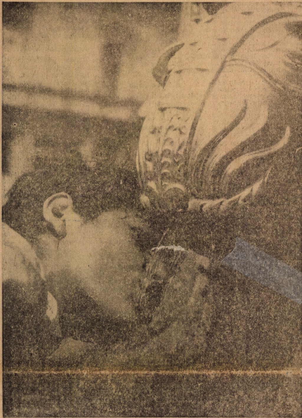
Csak tiszta forrásból