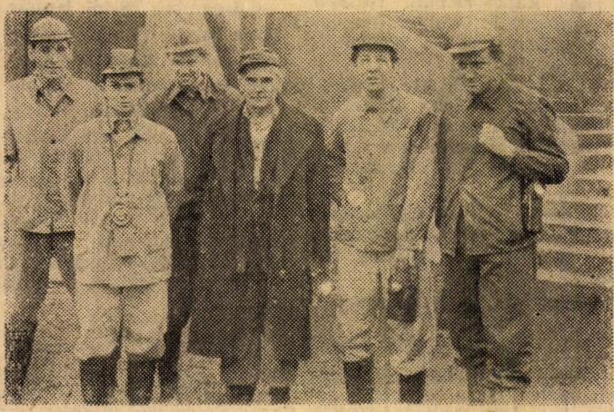
Jószerecsent!... a vizsgákhoz is!