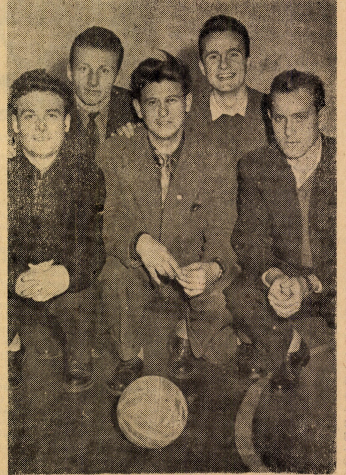
A IV. éves belkeresek győztes csapata.

A IV. éves belkeres fiúk szereplése meglepetést keltett, de teljesen megérdemelten szerezték meg az „egyetem legjobb teremfoci csapata” címet.