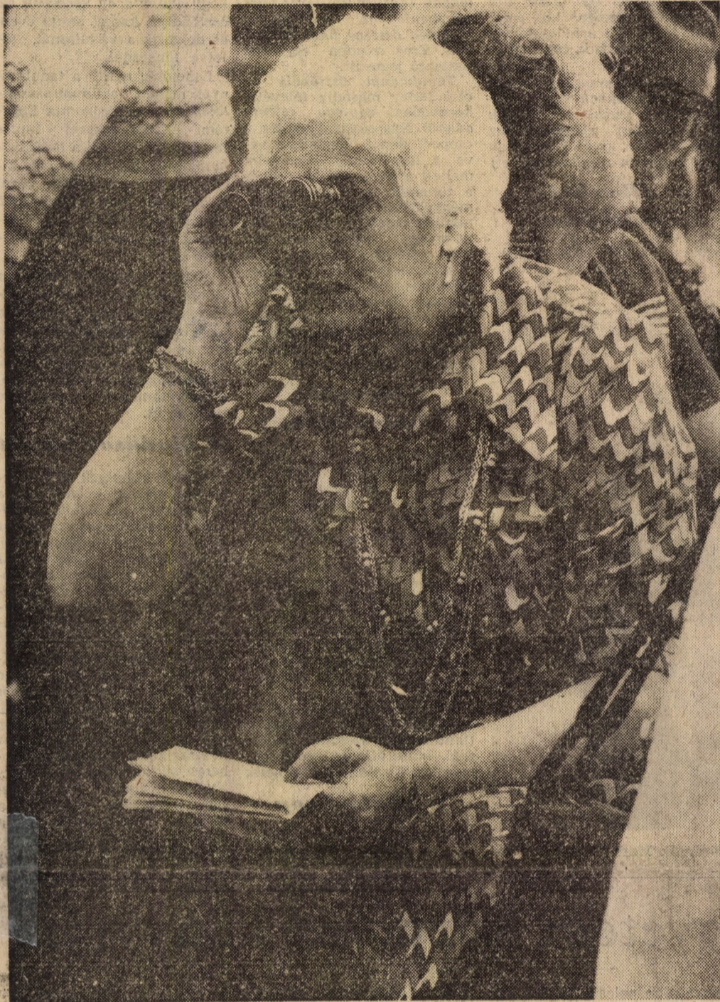
Ah, szóval ez a Közgáz!