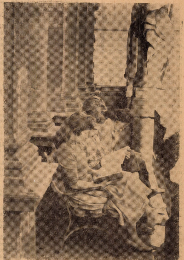
Kellemessé teszi a tanulást a tavaszi napfény a könyvtár teraszán