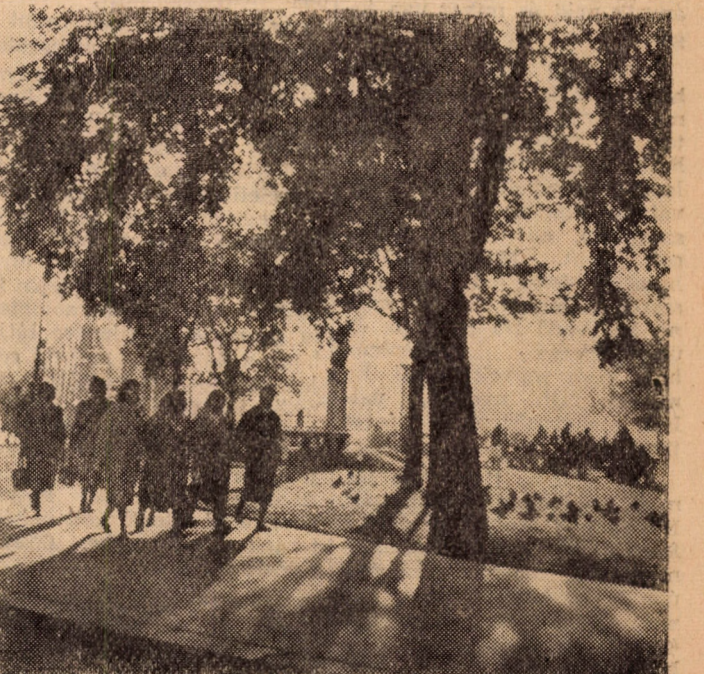
Előadás után jólesik egy kis pihentető séta