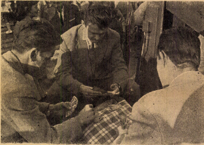
Minden időben, minden helyen kedvenc szórakozás: az ulti