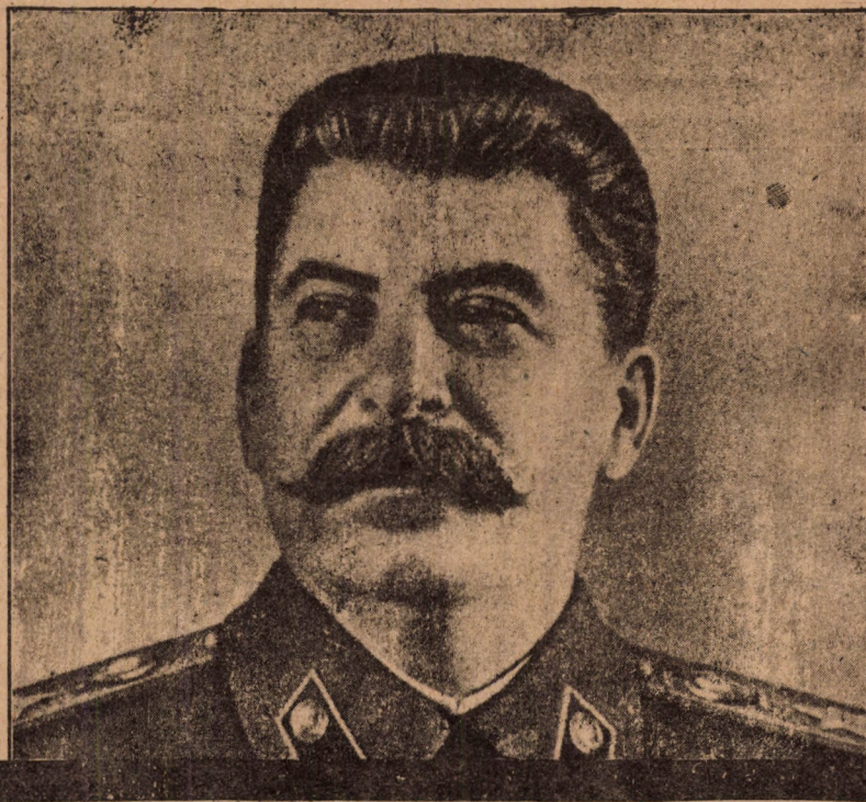
ELTÁVOZOTT TOLUNK KORUNK LEGNAGYOBB EMBERE SZTÁLIN

Sztálin elvtárs, a mi nagy Sztálinunk meghalt. Ravatala előtt áll az egész világ. Mély, kimondhatatlan fájdalom, mely eltölti az ifjak, férfiak és nők, agastyánok szívét. A nagy vezért, az édesapát gyászoljuk. Milliók tekintenek Moszkva felé, ahol a nagy Lenin mellé most Sztálin hajtotta örök álmra fejét. Felmerhetetlenül nagy a mi veszteségünk!