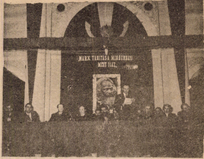
LEGYÜNK MÉLTÓK MARX NAGY NEVÉHEZ

Marx Károly Közgazdasági Tudomány Egyetem Vezetősége, Pártbizottsága, DISZ Bizottsága.