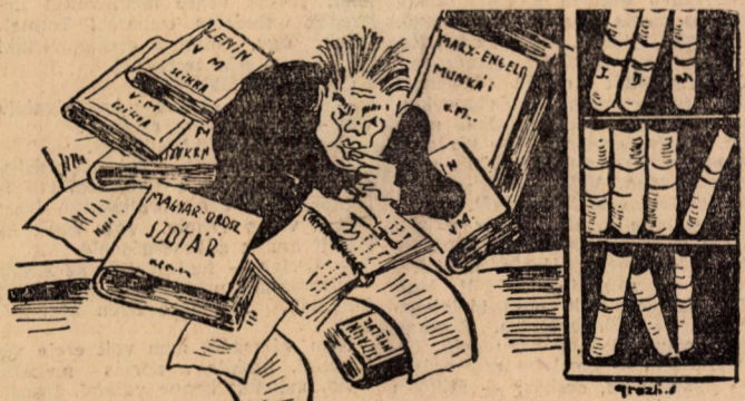
(Könyvtárunkban igen gyakori a könyvhalmozás)

egy iskola DISZ-szervezete és hallgatói problémáikkal hozzánk forduljanak. Végeredményben mindnyájan közgazdászok, kollegák vagyunk — mondtam — ami látszólag tetszett nekik. Kapcsolatunk megerősítéseketpén az alkotmányutcai Közgazdasági Technikum meghívta az egyetem hallgatóit október 10-én tartandó műsoros tanácsra, mely az iskola DISZ-termében lesz megtartva. A Bethlentéri iskola pedig egyetemünk kultúrcsoportját akarja meghívni egy vendégszereplésre.