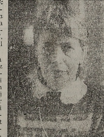
„Sok a diák, ezernyi problé-mával.”

feladatait, akkor van minden rendben. Szeretek ezen az egyetemen dolgozni. Tíz éve is hívtak az ELTE-re, de az utol-só pillanatban rájöttem, hogy nem érdemes itt hagyni a kö-zgáz, mert rugalmas, nyitott, érdekes. Szívesen csinálók itt bármit, mert érdemes. — Most oktatási igazgatóhe-lyettes lettél. Mit jelent ez? — Körülbelül az alapozós dé-kánhelyettes munkájával azo-nos egyelőre, amíg nincsenek felsőbb éves reformévfolya-mok. Hosszabb távon valószí-nűleg az első három évhez ka-pcsolódik ez a munka, az alap-diplomás kiséri el, a hallgató-kat. Sok adminisztratív mun-taátlan kúlcseMBER. A nehézségek másik fő cso-portja anyagi jellegű. A jelen-legi tankönyvtárral mellett a diákok nem tudják megvenni könyveiket még a hozzájárú-lással sem, ami különben is na-gyon hamar elfogy. Vannak az-tan megélhetési és lakásprob-lémáik is, s bár ezek nem tar-toznak közvetlenül az oktatás-hoz, azért nem lehet őket fig-yelmen kívül hagyni. — Mivel fordulnak hozzád a diákok? — Sok sikert kívánunk az új feladatokhoz! M. G.