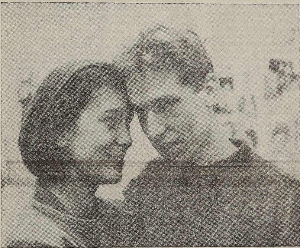
EZ A SZERELEM

(En táncolnék veled című cikkünk a 7. oldalon.)