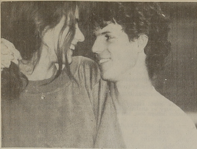
1994 perc szerelem