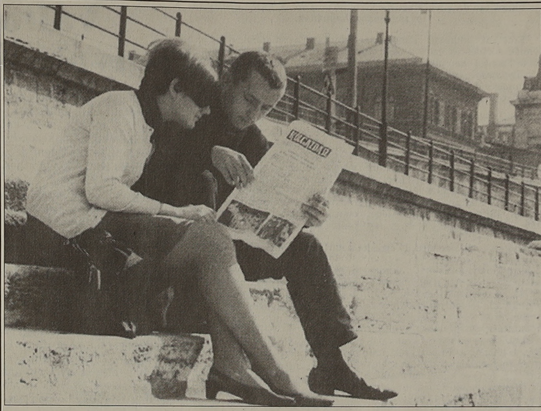
Volt egyszer egy Közgazdász

cióülések lesznek, majd este gazdasági és egyetemi vezetők panelbeszélgetésén vehetnek részt az érdeklődők. Az eszmecsere címe: Mit vár a gyakorlat a közgazdasági és üzleti képzéstől? Szombaton folytatódnak a szekcióülések, majd zárófogadással fejeződik be a konferencia.