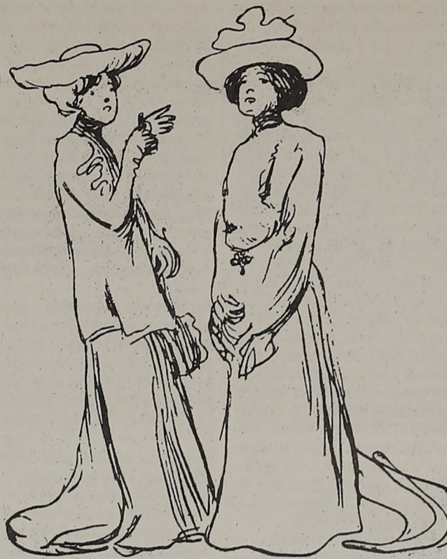
A Molnár jelenet eredeti illusztrációja a Józsi és egyéb kis komédiák című kötetből (1911)

A MÁSIK: A József-körúton. Nagyszerű kép. Igazi márványra van festve.