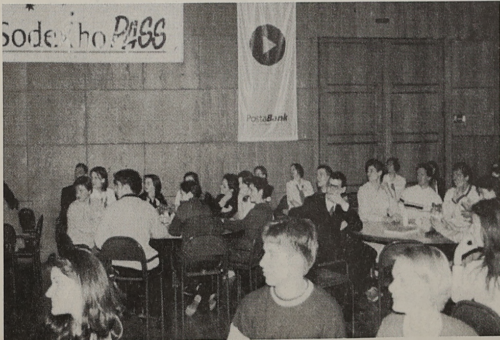
A szakmai vetélkedő résztvevői interaktív, játékos formában tanulhattak hazánkról

Végül a dokumentum hangsúlyozza, hogy ezt a gazdaságpolitikai pályát csak akkor tudja Magyarország tartani, ha folytatja a strukturális reformokat, melynek területei: az egészségügyi reform folytatása, az önkormányzati szféra átalakítása és pénzügyi reformja, valamint a közlekedési ágazatok közül kiemelten a vasút reformja, rendbetétele.