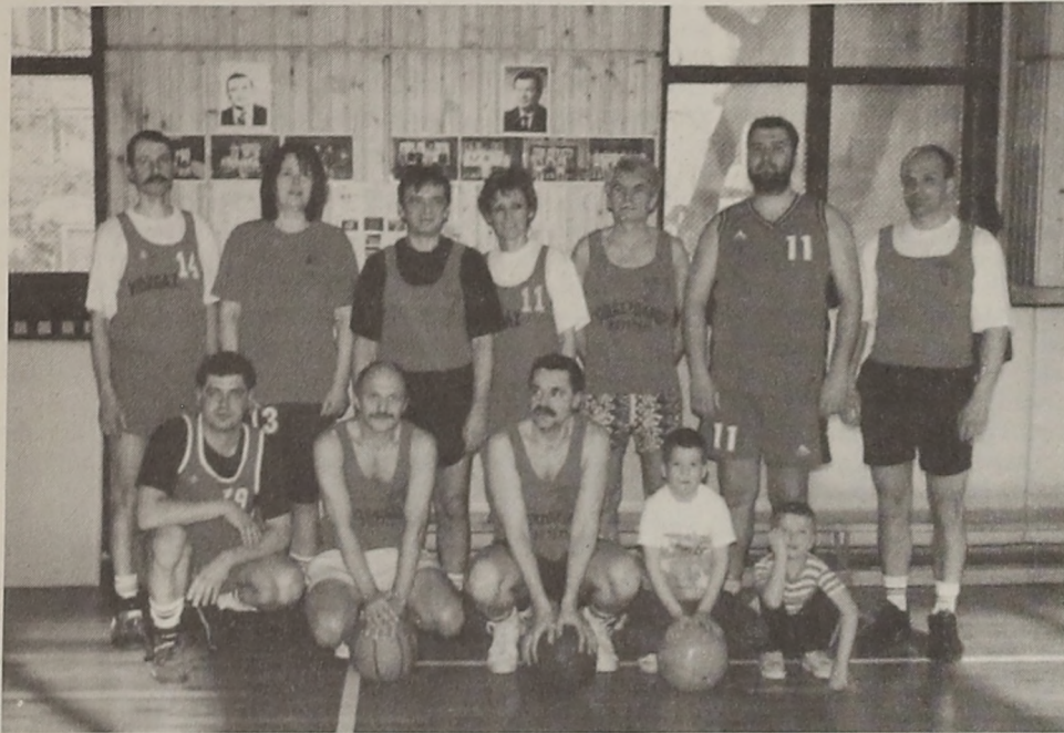
Az Emléktorna résztvevőinek apraja-nagyja