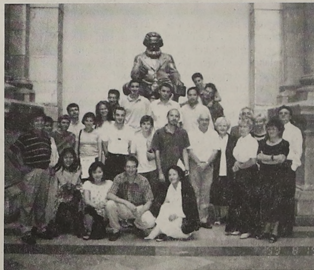
Múlt és jövő. Az 1. Budapesti Futures Course nemzetközi és hazai résztvevői, 1999

Jelenlegi kutatási projekteink - amelyeket OTKA programok és minisztériumi kutatási programok keretében művelünk - széles témakört fognak át: paradigmák a jövőkutatásban, az evolúciós modellezés jövőkutatási megjelenése, a tér-idő sajátosságai a kortárs filozófiában és a jövőkutatásban, Magyarország holnap után - komplex jövőkép-vizsgálat, a közgazdaságtan és a jövőkutatás viszonya, a különböző kortárs eszmearamlatok jövőtartalma, tudatos és nem tudatos elemek a jövővel való foglalkozásban, előtűnik és mögöttünk az ezredforduló. A Kutatóközpontban különböző tudományterületek neves képviselői kapcsolódnak, akikkel együtt