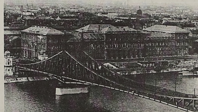
A háború nyomai a Közgáz épületén

lyek szükségessé teszik és indokoltá teszik, hogy e közgazdasági felső iskolát megajándékozzuk az egyetem jelzővel. Ez indok pedig az, hogy az egyetemi szónak ma oly varázshatása van, és a doktori címnek is, amelyet mással pótolni nem lehet. Az egyetemi hallgató és még inkább természetesen, a doktori cím társadalmi pozíciót ad