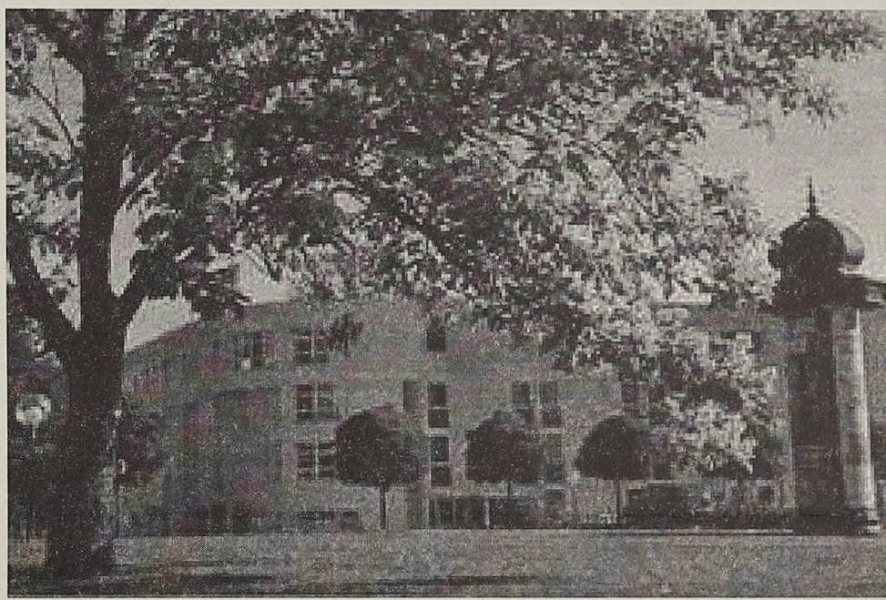
A félút után a megérkezés: ez már bizony Párizs