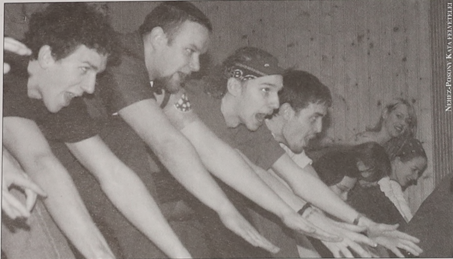
NEHÉZ-POSONY KATA FÉNYVETÉSEI