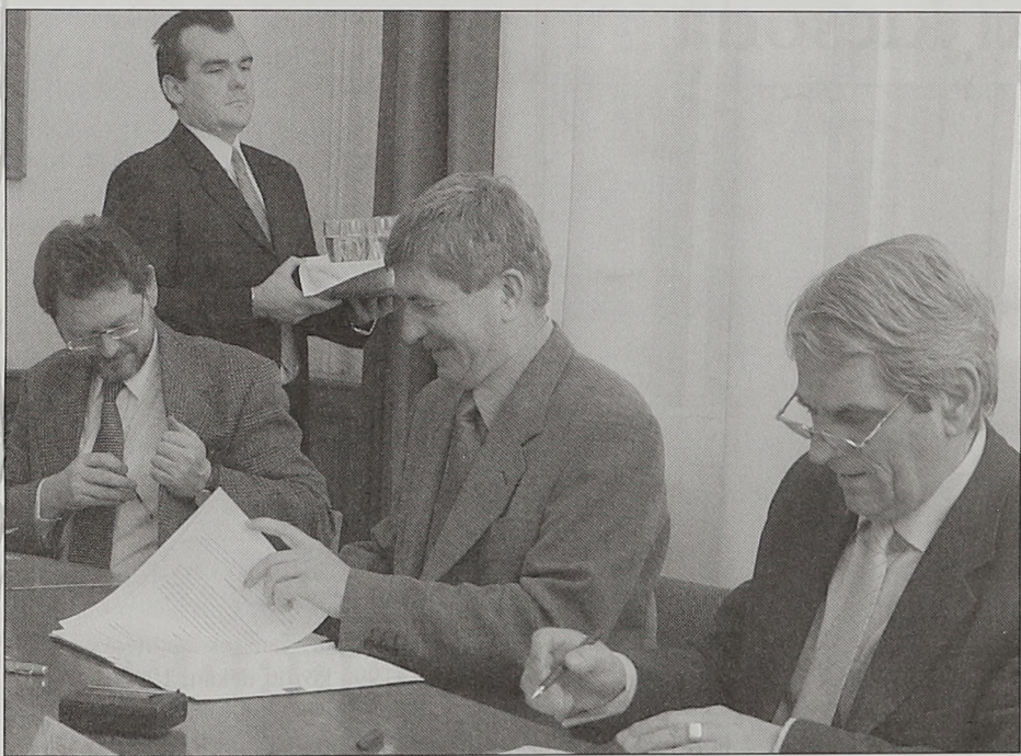
Az aláírás pillanatai

Együttműködési keretmegállapodást kötött a Budapesti Közgazdaságtudományi és Államigazgatási Egyetem a Paksi Atomerőmű Rt.-vel január 28-án.