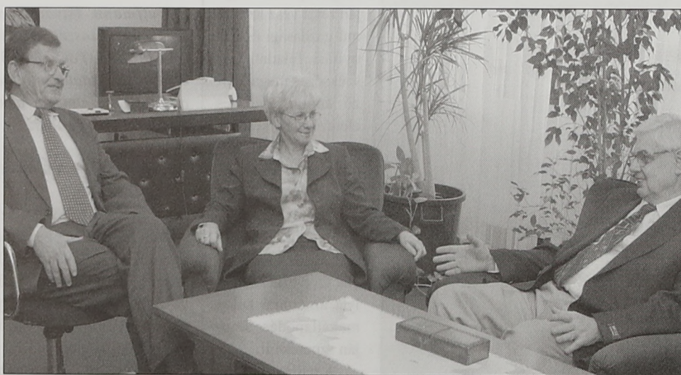
A Villányi úti dékánok