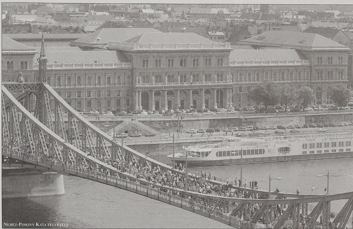
Két napig angol gyepszőnyeg borította a Szabadság hidat. Tudósítóink nem csak a főépület szomszédságában jártak az EU-csatlakozási buli idején. (Írásainkat az 5. oldalon olvashatják)