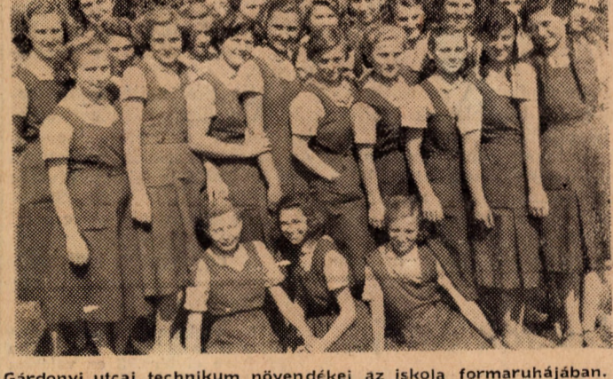
Gárdonyi utcai technikum növendékei az iskola formaruhájában.