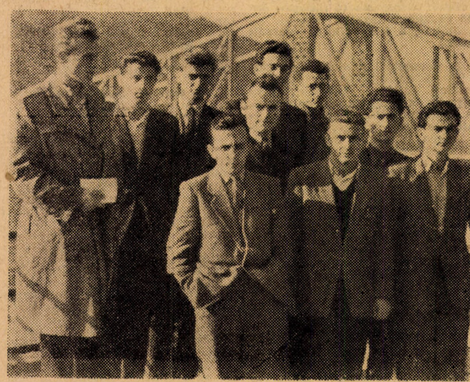
talva”, 4:1 arányban nyerték a mérkőzést.

A döntő első félidejében az iparosok 2:0-ás vezetésre tettek szert. Ezen az ellenfél csak szépen tudott. Fordulás után úgy látszott, hogy már-már ki egyenlítettek a kereskedelmi csapatok, de rövid ideig tartó meddő fölényük után egyre inkább magára talált az iparszak és vitathatatlan fölényben, szinte „sét-