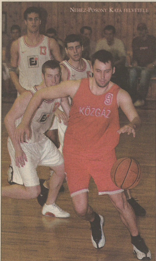
NEHÉZ-POSONY KATA FELVÉTELE