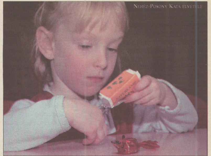
NEHEZ-POSONY KATA ELVETÉLE

Most tudtam meg, hogy mint minden rendes hírességnek, a szaloncukornak is megvan a saját rajongói oldala: Szaloncukor.hu. A szaloncukor-imádók lelkesen járják a világot, figyelik a külföldi üzletek polcait, hogy megtalálják-e rajtuk a karácsonyi finomságot vagy sem. Kiderül, hogy az USA-tól kezdve Kínán át Namíbiáig is-