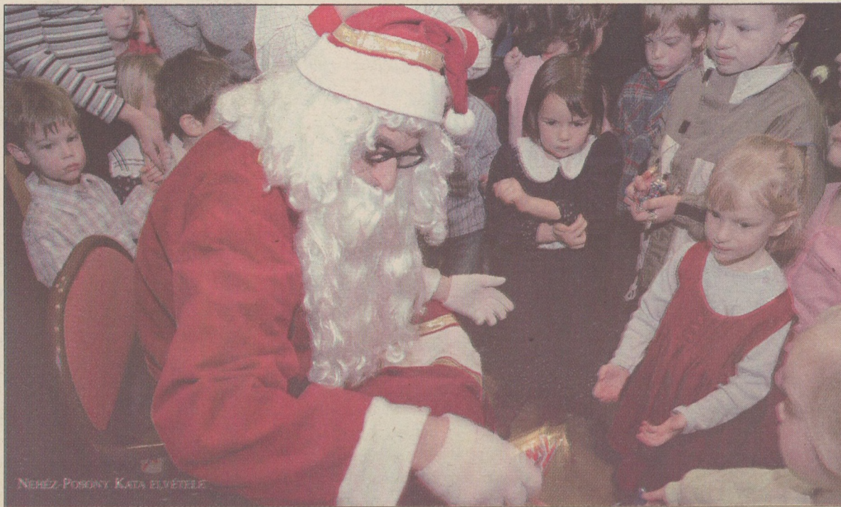
NEHÉZ PORSÓNY KATA ELVÉTELE

Ha itt jár, akkor tudható: még három hét és itt a karácsony. Az ünnep, amely a diákoknak a vizsgákra való készülődést is jelenti. Mi most az ünneppel foglalkozunk. (írásaink a 4–5. oldalon)