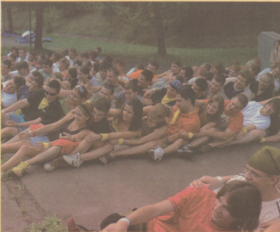
Néha nagy lesz a hajítás, de együtt minden sikerülhet