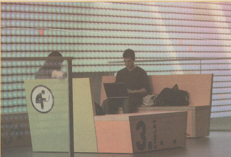
Alternatív tanulási módok

Hasonló, bár nem ilyen jó eredményekkel alkalmazható a „tudás a párna alatt” stratégia. Ennek is az a lényege, hogy mindegy mit csináltok, ha elég közel kerülsz a tudáshoz, az bármiféle gond nélkül be fog szállni a fejetekbe. Az ember persze megpróbálja összekötni a kellemest a haszonnal, így legkedveltebb alkalmazási módja