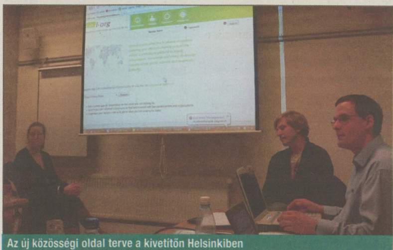
Az új közösségi oldal terve a kivetítőn Helsinkiben

■ Első lépésként határozzunk meg szervező témákat, ezek lesznek a polcok. Vizsgáljuk meg az ENSZ könyvtárunk anyagát aszerint, melyik határozatot, melyik témához sorolnánk, majd rakjuk fel a polcokra! Rendeljünk hozzájuk kulcsszavakat, hogy könnyen lekereshetőek legyenek a dokumentumok! Ha ez kész, keressünk kapcsolódó anyagokat, döntéseket, határozatokat a témákhoz, rakjuk őket a polcok mellé és hagyjunk üres helyet, hogy mások is megtehesék ugyanezt. Tegyük mindezt on-line, az első program neve legyen un-informed.org, a második pedig un-i.org!