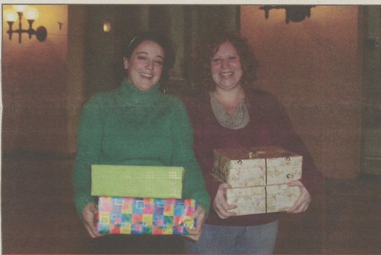
Már az első héten több tucat dobozt töltöttek meg ajándékkal egyetemünk polgárai

A karácsony mindenki számára más és más üzenetet hordoz. A gyerekek minden nap izgatottan kérdezik, mennyit kell még aludni, az idősebbek már két-három héttel előtte elkezdik tervezni a tökéletes menüt, de mindennél fontosabb, hogy a karácsony szellemisége minél több emberhez eljusson. A gazdasági változások következtében aktu-