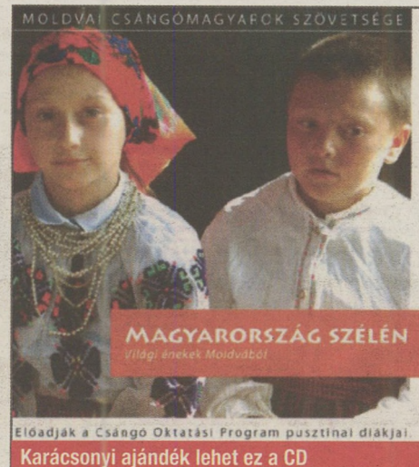
Előadják a Csángó Oktatási Program pusztinai diákjai. Karácsonyi ajándék lehet ez a CD

Akit bővebben érdekel a csángók oktatási programja, esetleg segíteni is szeretné őket csomagküldéssel, adó 1%-kal, egy-egy kisdiákot rendszeresen támogató „keresztszülőként”, vagy éppen szívesen töltene pár napot gyönyörű, garantáltan térormentes természeti környezetben, vendég-