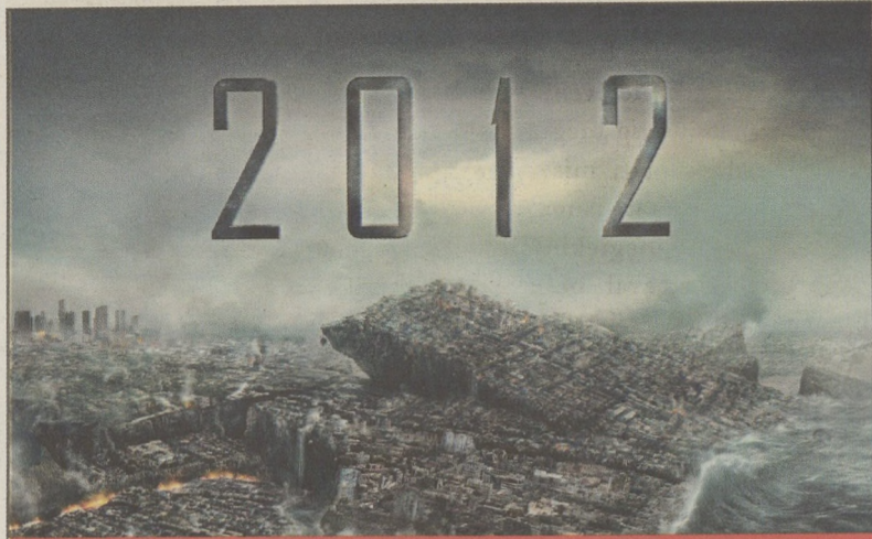
2012 – Kalifornia kiválik az USA-ból

■ Van olyan nap, amikor úgy érzed, nem volt érdemes felkelni. Roland Emmerich rendező szerint ez 2012-ben jön el, szóval gondold meg, hogy jövő év végén lefoglalod-e a nyári repjegyet. Igazából azt is érdemes meggondolni, hogy megnézed-e a 2012 című animációs filmtechnikával készült mozit. Hogyan deríthetjük ki, hogy érdemes-e? Vagy elolvassuk egy keserűes kritikát, vagy megnézzük a film készítőit / szereplőit (szigorúan benchmark jelleggel), vagy ráúszunk az előzetesre és megpróbáljuk felfejteni a sztorit.