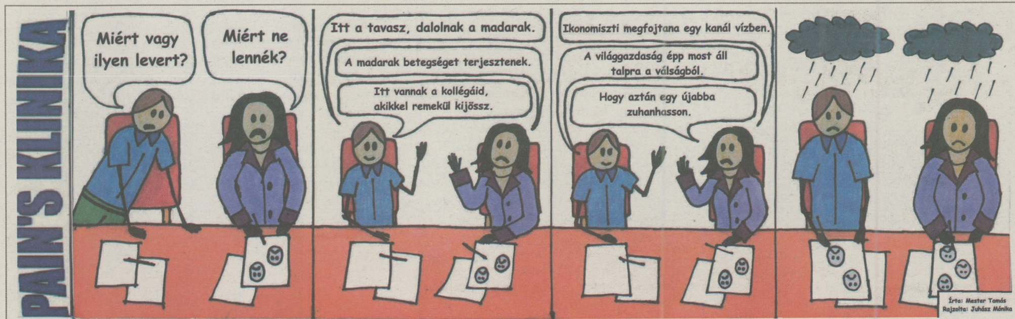
Írta: Mester Tamás Rajzolta: Juhász Mánika