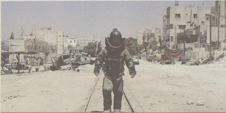
Tájkép, bombaszakértővel – Bombák Földjén

■ Bevallom őszintén, hogy amikor elkezdtem nézni a Bombák földjét, arra számítottam, hogy 2 órányi jó vs. gonosz harc eredményeképp a nyugati demokrácia legyőzi az emberölő terrorista nem-demokráciát és mindenki boldogan megy haza a mozi-ból. Szerencsére nem ilyen egyszerű mozi a Bombák földjén.