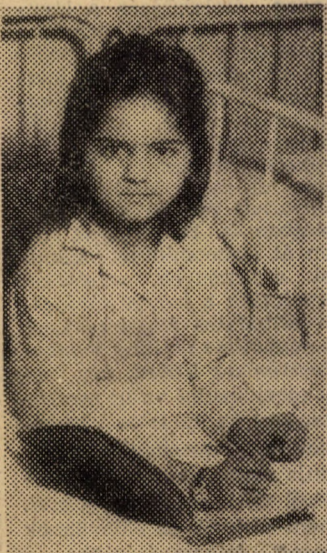
Egy kislány azok közül, akiknek életéről van szó.

Az önkéntes veradó nap február 28-án, kedden lesz. Jó lenne megismertelni a tavalyi szép eredményt. Jó lenne ismét jelesre vizsgálni emberségéből.