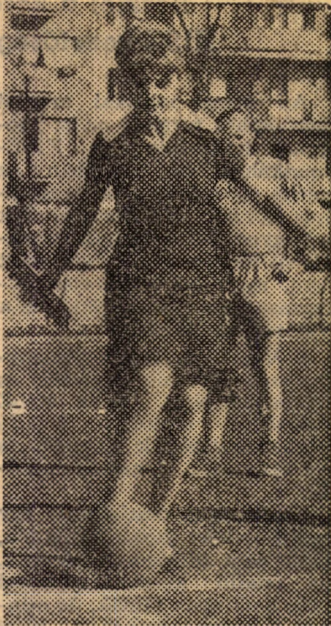
Kezddörűgás: Miss Közgáz

M. N. Taktikai fegyelmetlenség történt. Edzőnk azt a feladatot adta a középcsatárnak, hogy a középpályán cselezze ki az egész védelmet és a kapust is lefejtette, löjje be az első gólt, és ezt