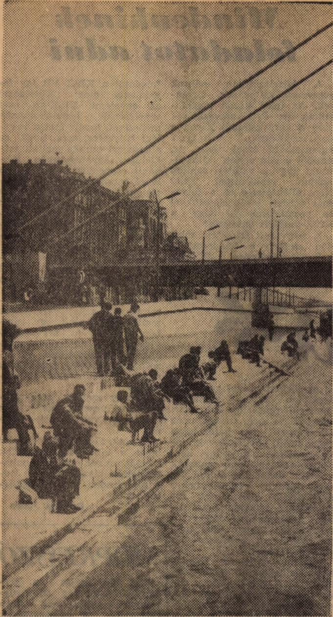
Benépesül a „Duna-parfi kihelyezett tagozat”