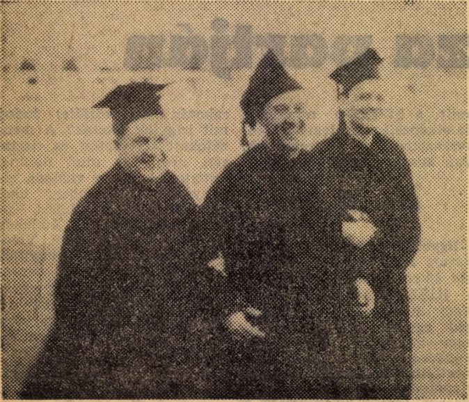
„És most igazi oktatókat láthatunk a pályán...”

Kutyautók—Kutyautók Elen. A Műszaki Egyetem Becsenyi kollégiumának lakói nagy szeretettel fogadták a számukra nyújtott soronkívüli szórakozást. Látva példánkat, miszerint nemcsak játszottunk, hanem rögtön közvetítjük is a meccset, ők is bekapcsoltak egy hangszórót. Csapatunk jobbszélsőjét, miután labdát nem kapott, egyedül ez a külön műsor foglalkoztatta. Állítólag jó szórakozott rajta. Jobban mint a meccsen. Ezen nem is eszünkünk. — patkó —