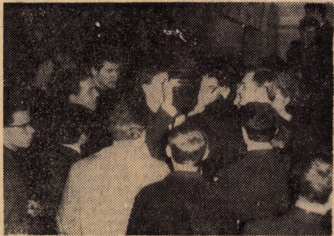
„Híres emberek” összegyűjtése a vetélkedő szünetében