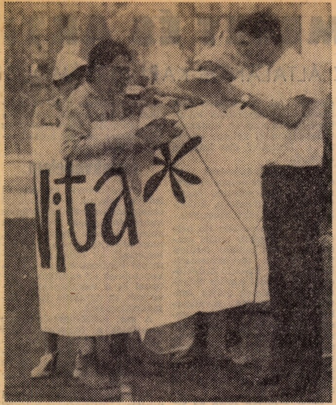
Bauer: „Kissé váratlanul ért a kérdés, de...”

A csapatok osztályzatai: Firkászok: jeles, Kulturális együttesek: elégséges. A firkászok kiemelkedő teljesítményt nyújtottak, végig tartották a taktikai utasításokat, s rendre megvalósít-